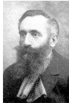
Vivo de Lanti - 13 junio

Depende de la progreso tra la parkoj, la promeno finiĝos ĉe unu el la stacioj Green Park, Hyde Park Corner, aŭ (per Hyde Park) Marble Arch.