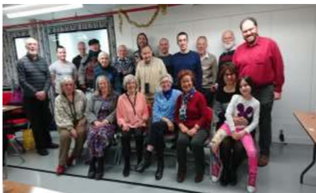
Partoprenintoj en la Novjara Festo de LEK